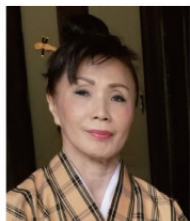
大工 苗子 (特別出演)

沖縄県無形文化財(八重山民謡)技能保持者。沖縄県八重山郡石垣市字新川出身。八重山民謡を山里勇吉氏に師事。2015年、琉球民謡音楽協会名誉会長に就任、同年、全沖縄の民謡協会9団体の共同代表となる。2021年、沖縄県文化功労賞受賞。八重山地方に伝承される多彩な島の歌をこなし八重山民謡の第一人者として地位を築いている。その島唄に愛情を込めて歌う姿勢には共感者が多い。また八重山民謡教室の支部を全国に持ち、沖縄・八重山民謡の普及・育成にも力をそそぐ。現在、沖縄でもっとも幅広い活動をしているミュージシャンである。